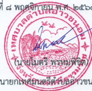
นายกเทศมนตรีตำบลอ่าวขนอม

หมายเหตุ ผู้ประกอบการสามารถจัดเตรียมเอกสารประกอบการเสนอราคา (เอกสารส่วนที่ ๑ และเอกสารส่วนที่ ๒) ในระบบ e-GP ได้ตั้งแต่วันที่ซื้อเอกสารจนถึงวันเสนอราคา